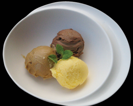
GELATO (ice cream) ジェラート3種盛り合わせ 380