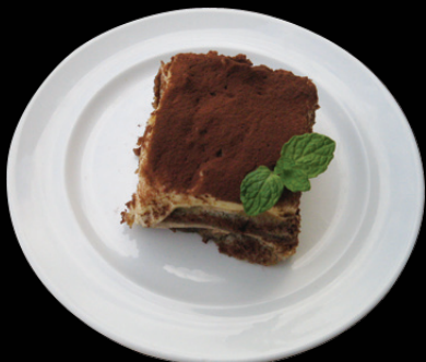
TIRAMISU 自家製ティラミス 420