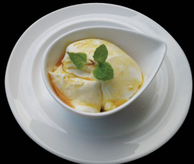
PANNA COTTA 自家製パナナコッタ 400