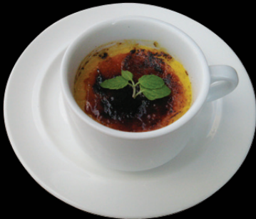
CREME CARAMEL カタラーナ 420