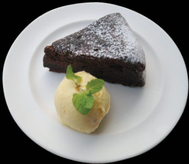
CHOCOLATE CAKE トルタ ディ チョコラータ 460